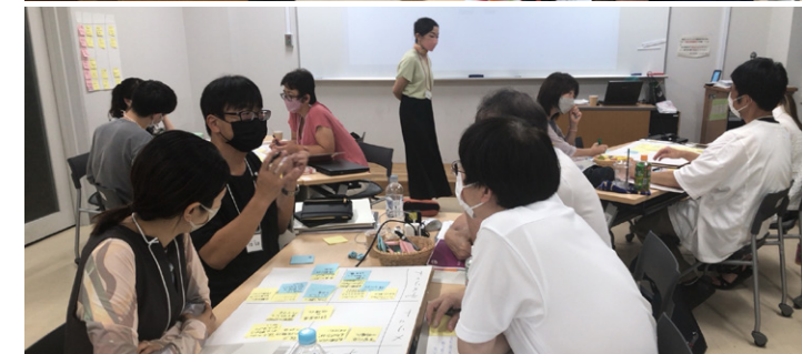
写真:Coursera「インタラクティブ・ティーチング」第1回リアル・セッション(2022年9月開催) トピック例:模擬授業、クラスデザイン、TP/SAPチャート作成...など